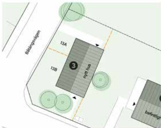
Exempel på nytillskott av bostad på tomten