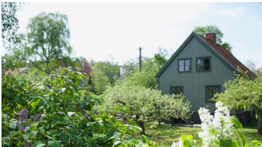
Det befintliga huset, byggt på 1920-talet, med prunkande trädgård.

Byggemskapsgruppen har fått ett positivt bemötande från grannarna, förmodligen till stor del tack vare att de bjudit in till en inkluderande och öppen process.