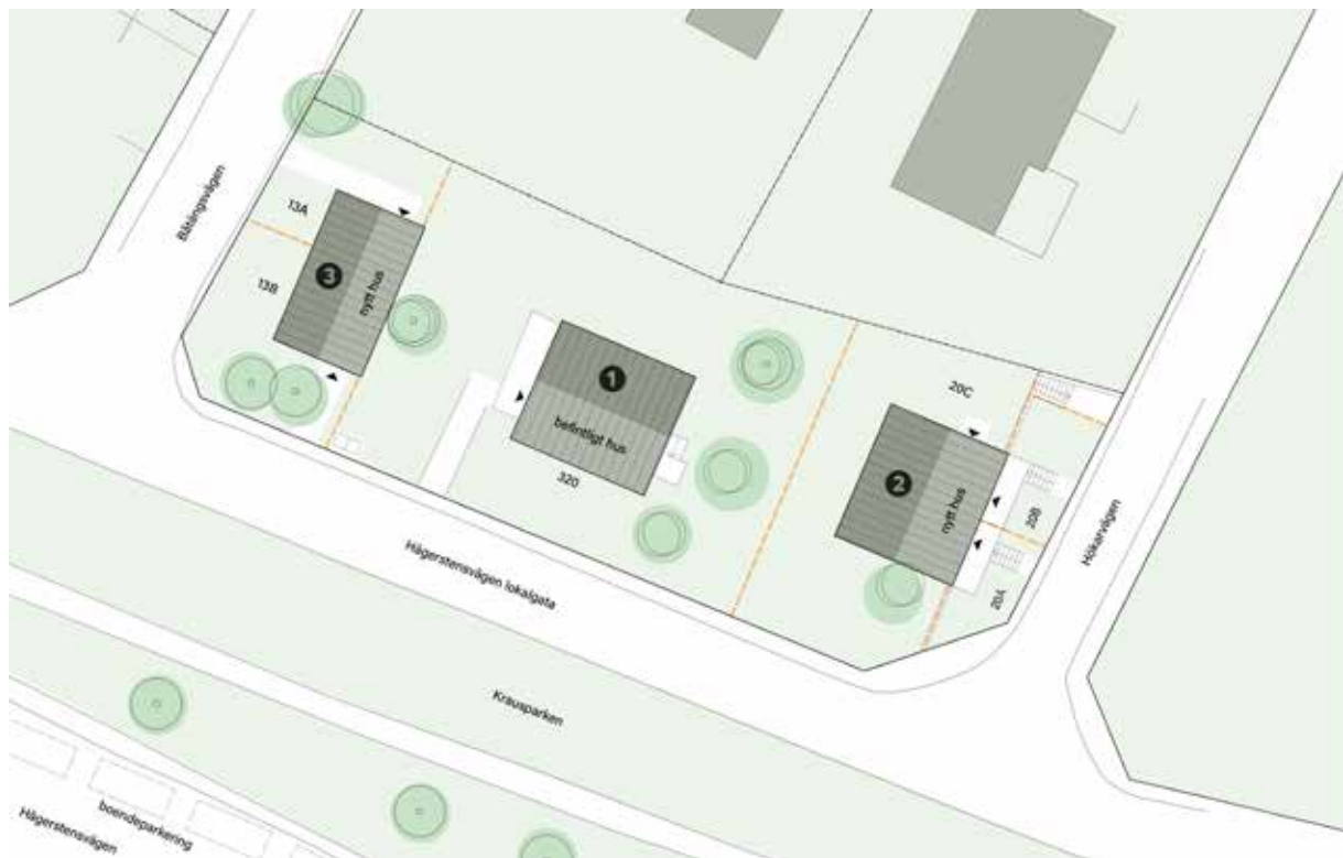
Situationsplan med befintligt hus i mitten och de nya hus som kommer till på båda sidor om 1920-talshuset.