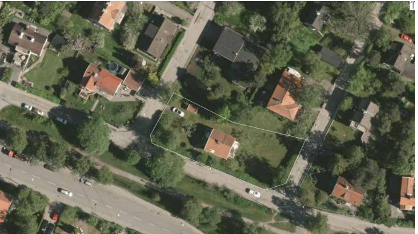
Flygfoto med fastighetsgräns markerad.

Vid utformningen av de två nya husen på tomten har man försökt jobba i enlighet med områdets karaktär i skala och material, samtidigt som de nya byggnaderna ges moderna kvaliteter, till exempel i form av stora glaspartier. Det har också varit viktigt att skapa en egen huskänsla och trevnad genom att alla bostäderna får egna entréer, har egna utgångar till trädgården och bostäder i flera plan. Inne-ute-sambandet ska vara starkt, så att trädgården blir en naturlig förlängning av bostaden.